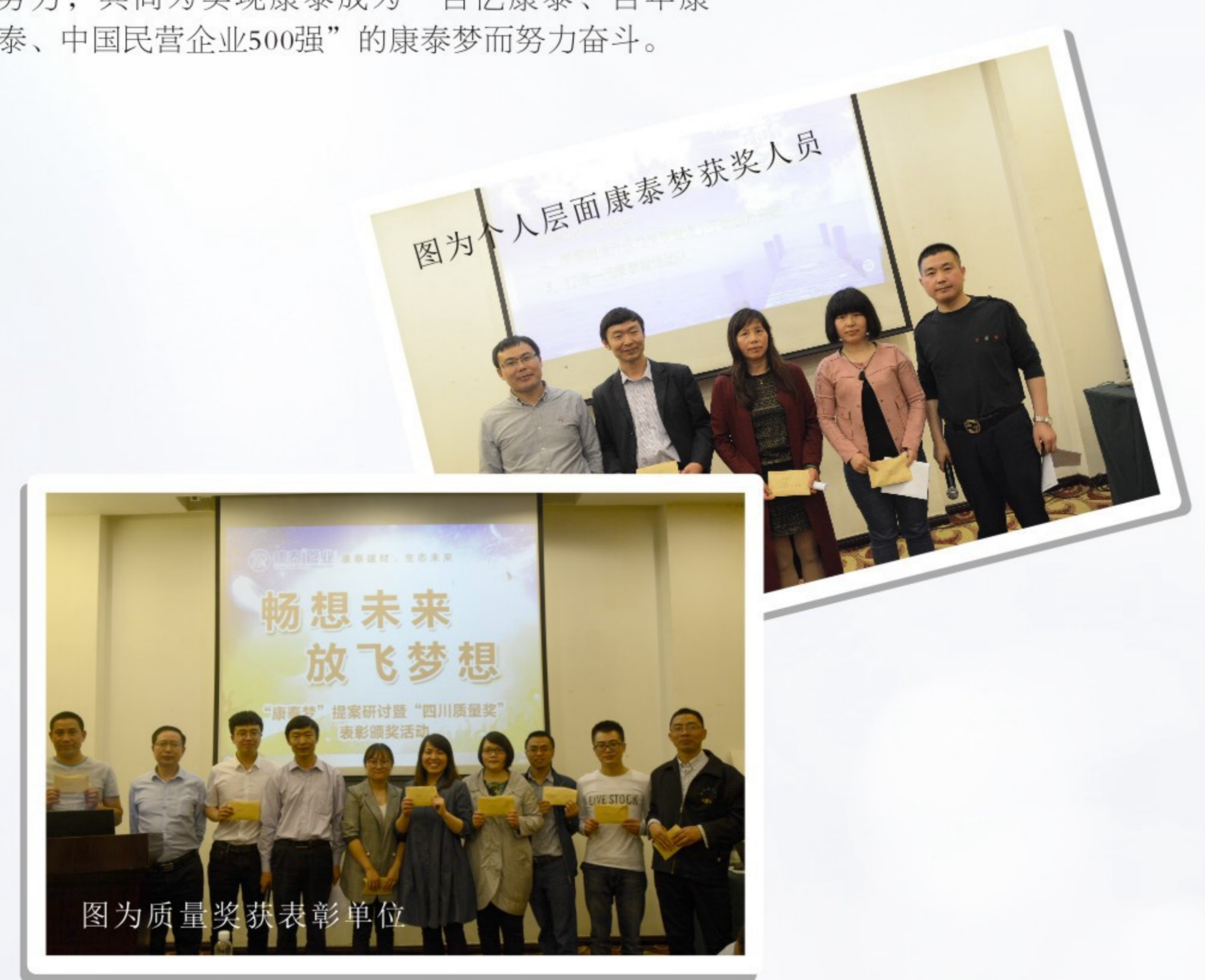
图为公司层面康泰梦获奖人员