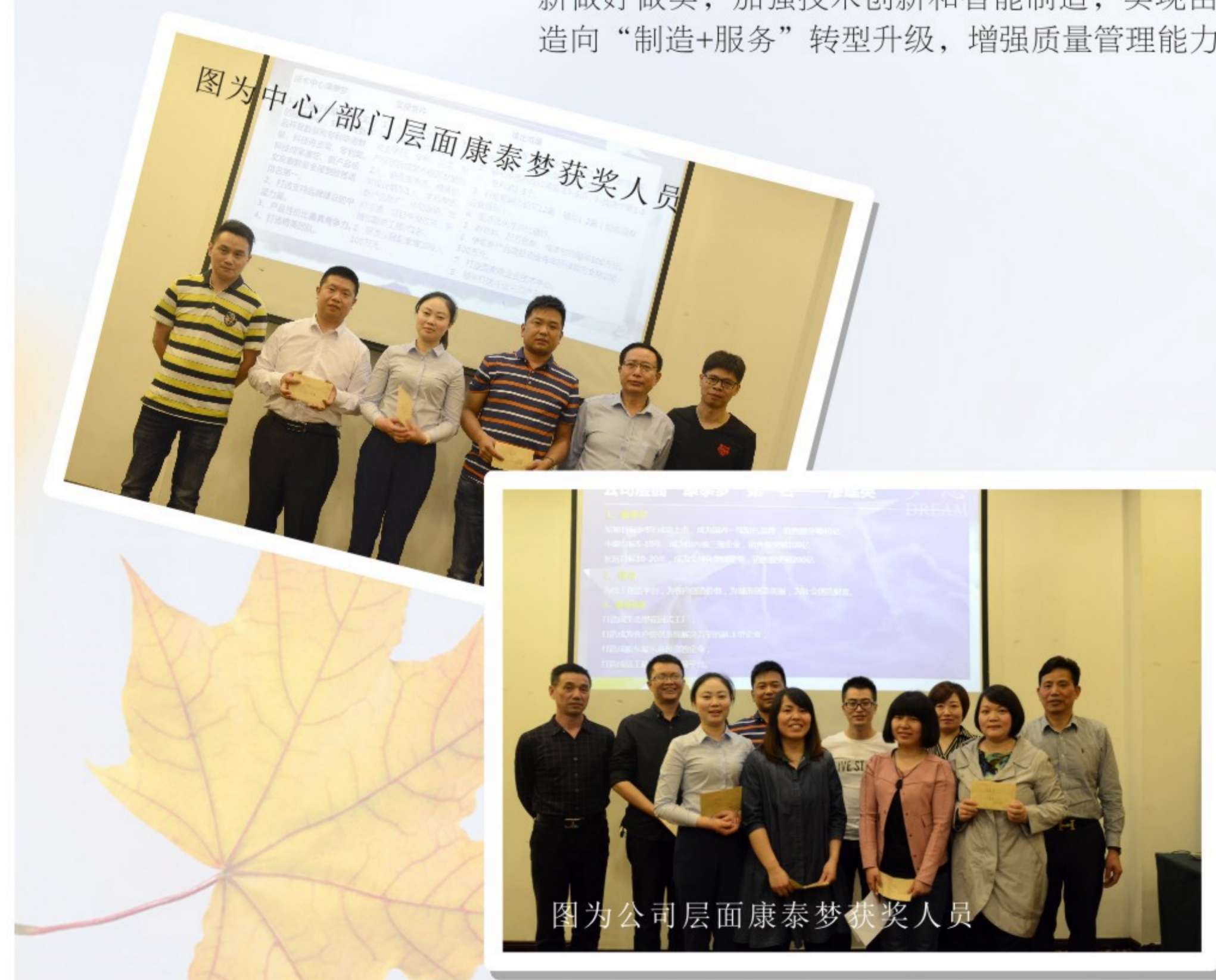
图为中心/部门层面康泰梦获奖人员

下午18时，在结束各项议程后，会议圆满结束。本次会议以获得四川质量奖为契机，畅想未来，放飞梦想，围绕品质康泰和康泰梦进行头脑风暴，不仅更加清晰了目标，明确了方向，也为实现康泰梦注入了强大力量源泉。全体康泰人也要倍加努力，共同为实现康泰成为“百亿康泰、百年康泰、中国民营企业500强”的康泰梦而努力奋斗。