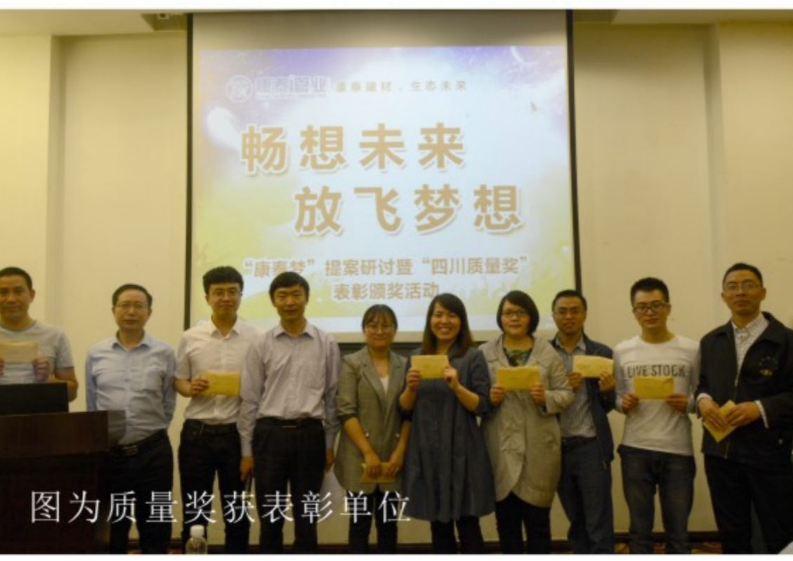
图为公司层面康泰梦获奖人员